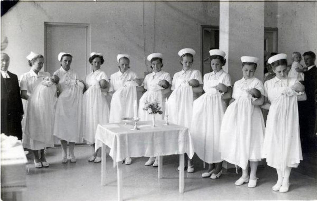
Turvaan tuotujen vauvojen joukkokaste Oulun Joulumerkkikodissa.