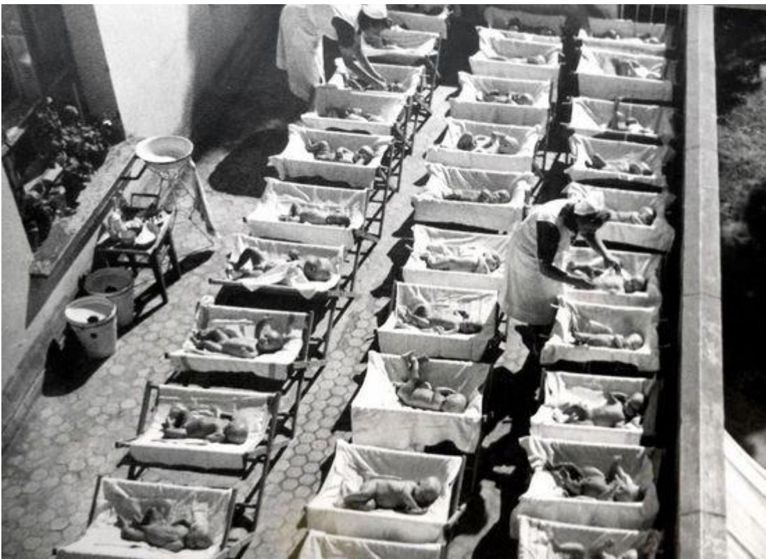
Vauvat "aurinkokylvyssä" Oulun Joulumerkkikodin parvekkeella. Valon ja raittiin ilman uskottiin tehoavan tuberkuloosibakteereihin.

Talo sai varansa tuberkuloosin vastaisen työn joulumerkeistä, joita suomalaiset ostivat liimattavaksi joulupostiin. Siksi paikka tunnettiin Joulumerkkikotina.